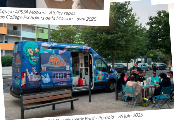
PS SIJM Quartier Petit Bard - Pergola - 26 juin 2025