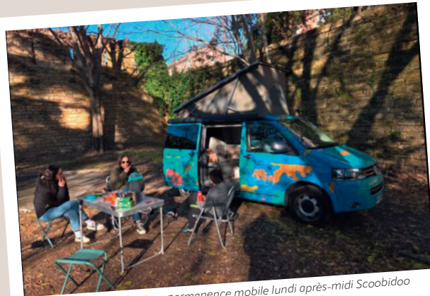
Équipe APS34 Centre - permanence mobile lundi après-midi Scoobidoo