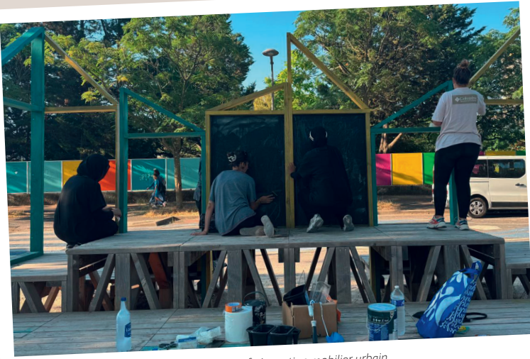
Chantier éducatif rénovation mobilier urbain Espace G. Halimi - Mosson - juillet 2025