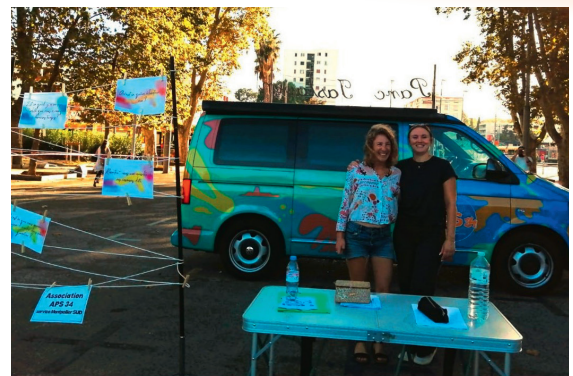
Équipe APS34 Saint-Martin - Croix d'Argent Fête des associations quartier Croix d'Argent - septembre 2025