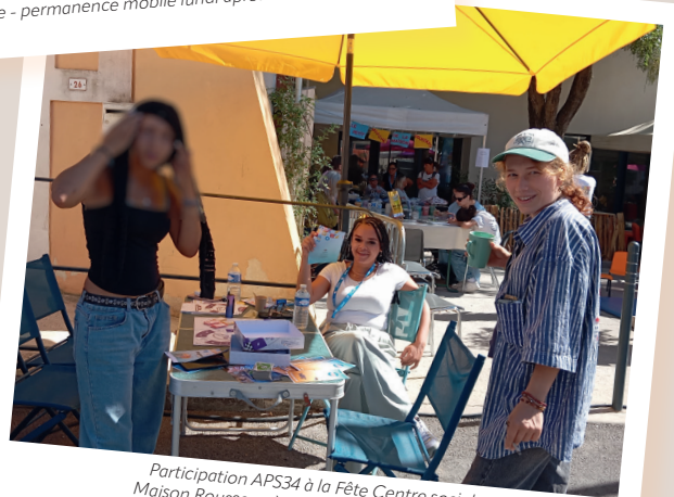
Participation APS34 à la Fête Centre social Maison Rousseau à Lunel - 19 septembre 2025