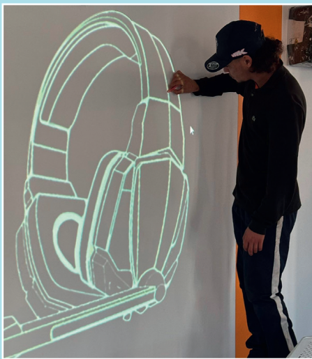
Fresque Espace GHINS MLJ3M Petit Bard – Novembre 2025