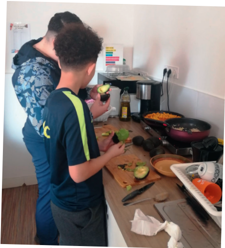
Équipe APS34 Mosson - Atelier repas Classe Relais Collège Escholiers de la Mosson - avril 2025