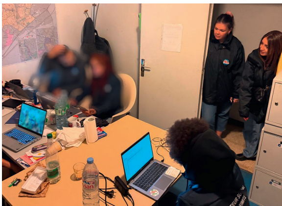
Visite des éduc APS34 aux médiateurs ville de Montpellier Quartier Mosson 16 octobre 2025