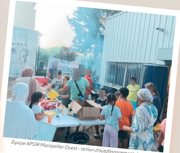
Équipe APS34 Montpellier Ouest - action d'autofinancement de séjour